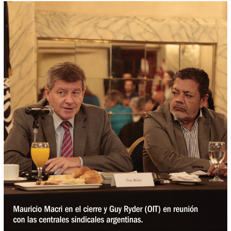
Mauricio Macri en el cierre y Guy Ryder (OIT) en reunión con las centrales sindicales argentinas.

El evento recibió a delegaciones provenientes de más de 100 países del mundo, integradas por representantes de los sectores empresario, sindical y gubernamental. Durante las jornadas de trabajo, los participantes debatieron sobre posibles soluciones que permitan poner fin al trabajo infantil y el trabajo forzoso, y promover el empleo joven.